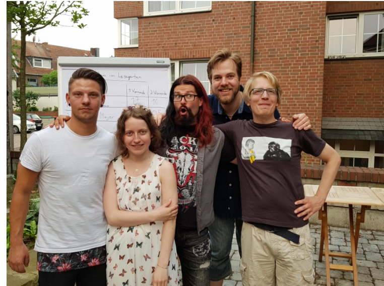
Poetry Slam, 9. Juni